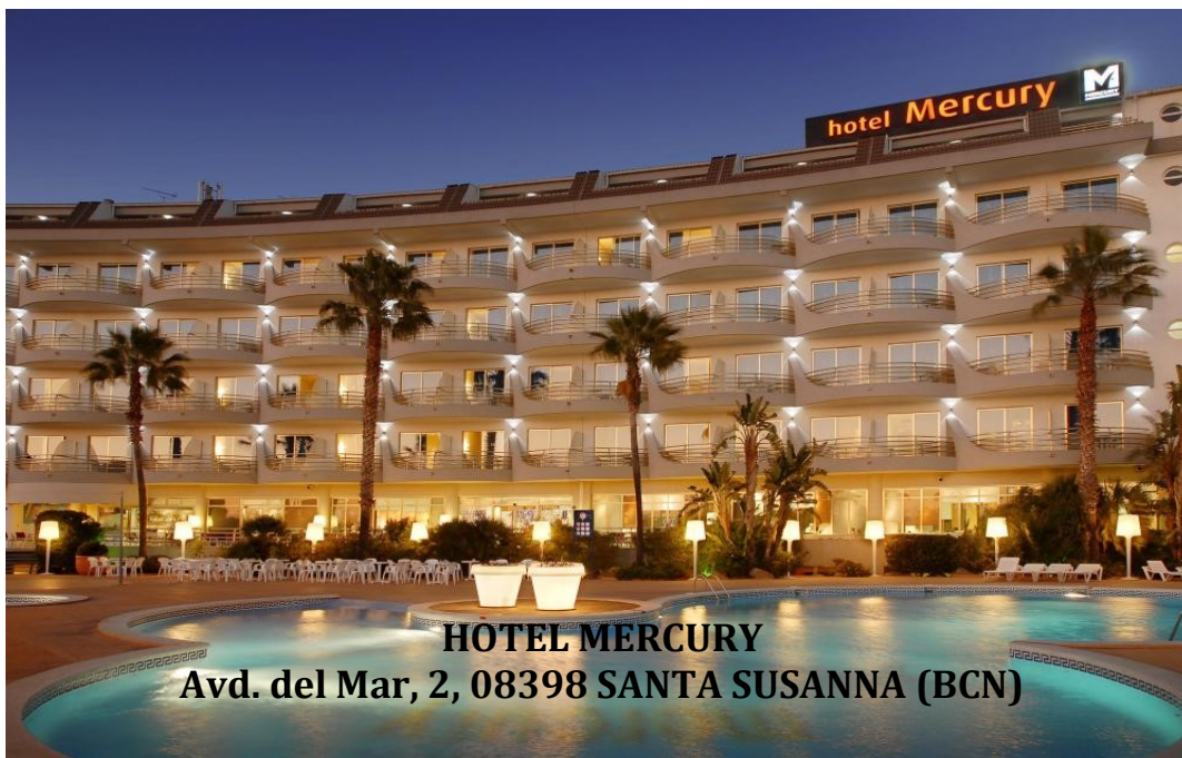
HOTEL MERCURY Avd. del Mar, 2, 08398 SANTA SUSANNA (BCN)